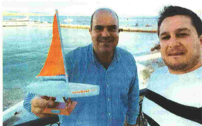
Η πλατφόρμα δίνει τη δυνατότητα σε επίδοξους ταξιδευτές του ονείρου να συγκρίνουν τιμές ναύλωσης-ενοικίασης ενός σκάφους και να απολαύσουν τις διακοπές τους όσο πιο οικονομικά μπορούν και, πάνω απ' όλα, με υγειονομική ασφάλεια πάνω στο σκάφος